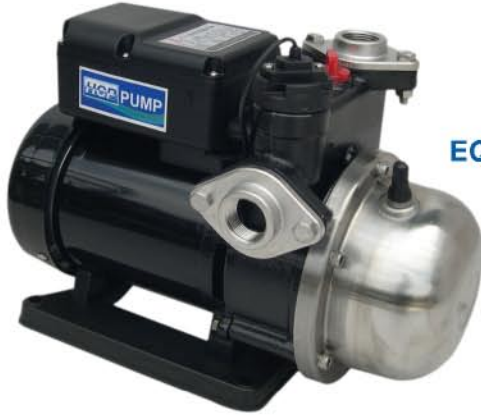
EQ - 200