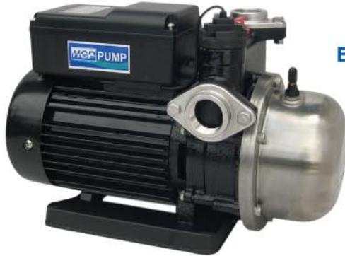
EQ - 800