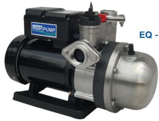
EQ - 400S