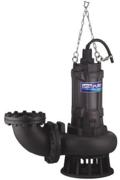
AF - 815 • 820