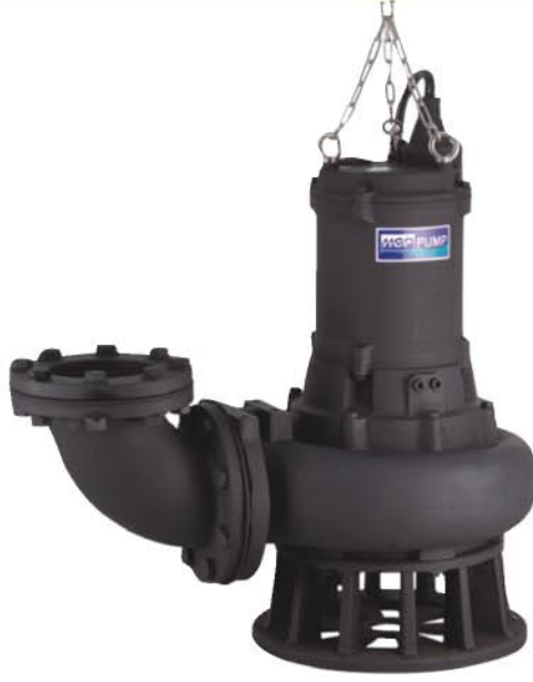
AF - 610 • 615 • 620