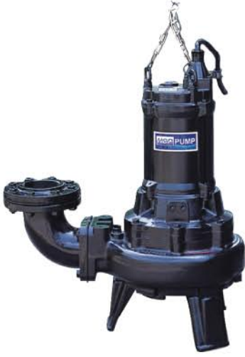
AF - 55 • 75